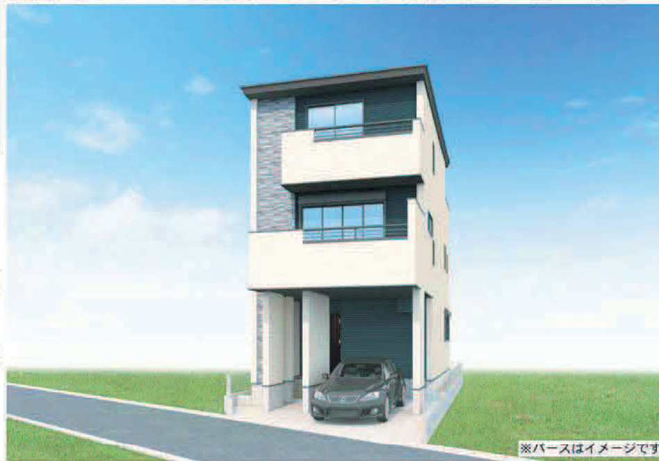
※パースはイメージです。

3路線利用可!高津駅まで徒歩5分◎ 水廻りワンフロアで家事ラクなプランば子育て世帯に優しい住まい!