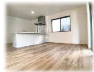
※施工例などのイメージ写真です。